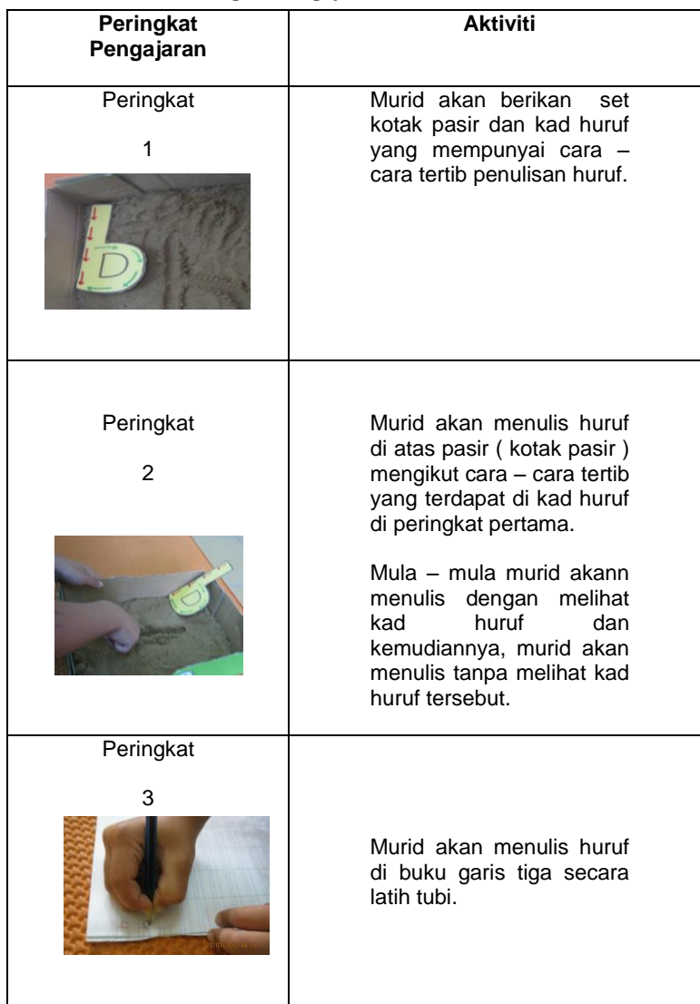
Jadual 1 Peringkat Pengajaran

Bagi mengukuhkan pemahaman dan penguasaan murid saya akan memberi ujian pengukuhan pada 17 Februari, 24 Februari, 2 Mac, dan 7 Mac iaitu di sesi terakhir interaksi dalam seminggu. Jadual 2 menunjukkan rekod pengedaran Ujian Dignostik, Ujian Pengukuhan dan Ujian Pengesanan Akhir